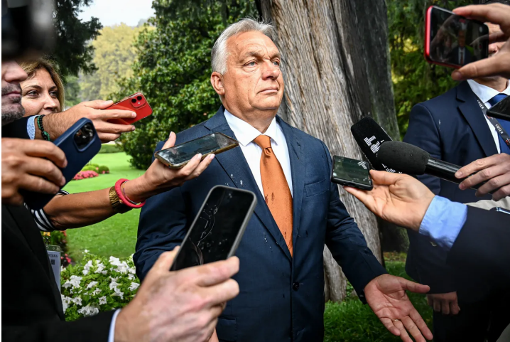
De Hongaarse premier Viktor Orbán staat de pers te woord op een congres in Italië.

Populisme De methodes van lang zittende machthebbers in Hongarije, Polen en Slowakije vormen een blauwdruk voor populistten overal ter wereld. Pak de rechtspraak aan, schakel de media uit en snoer critici de mond.