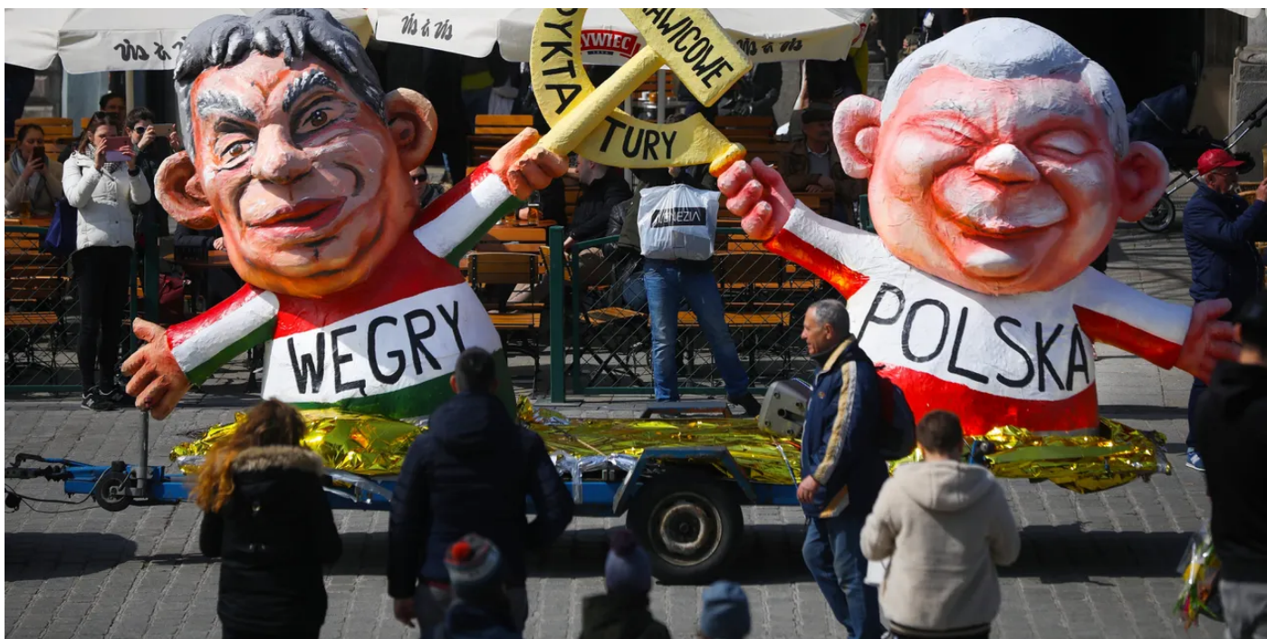
Poppen van de Hongaarse premier Orbán en PiS-politicus Kaczynski bij een protest in Polen (2019).