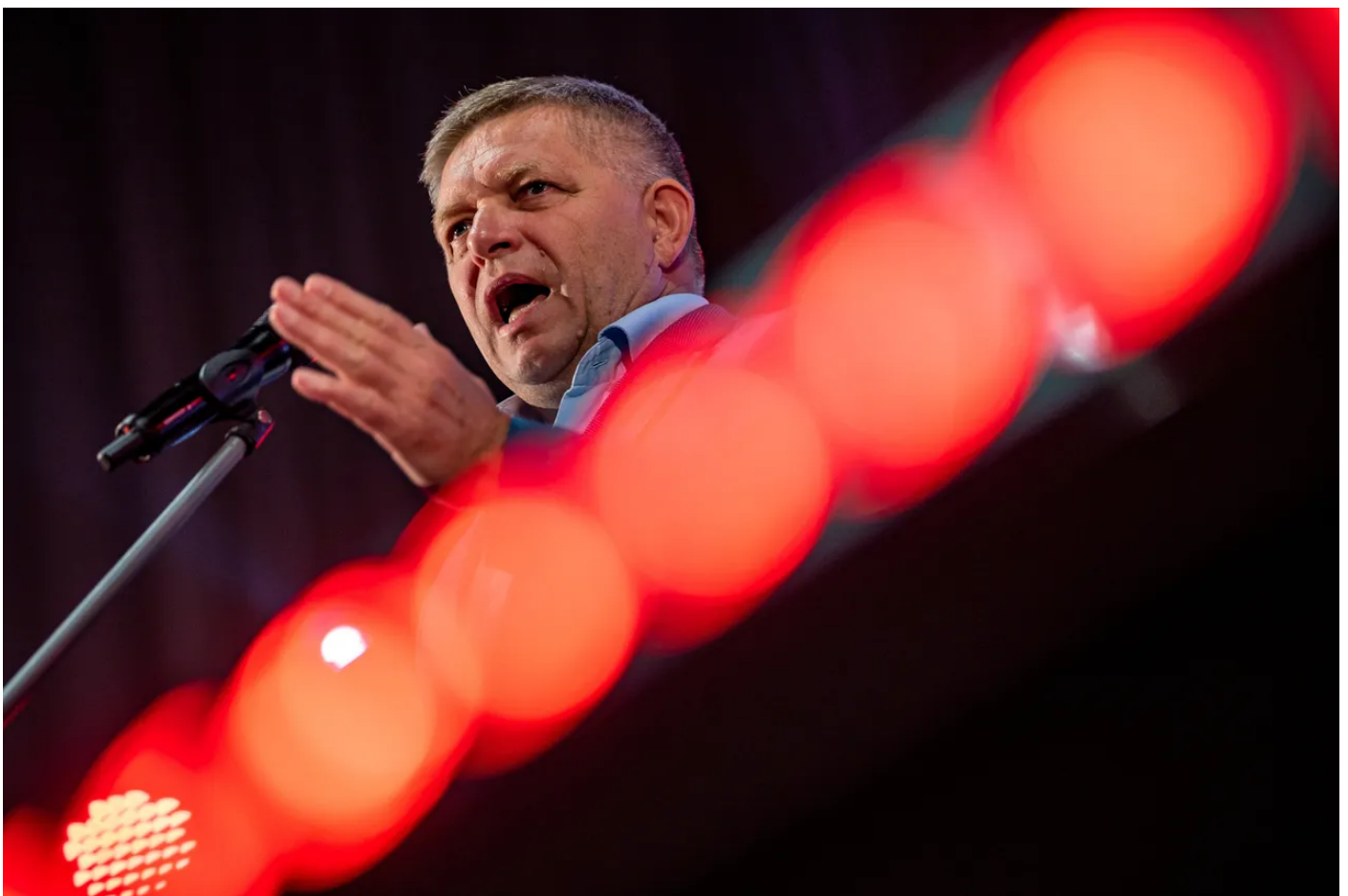
De Slowaakse premier Robert Fico tijdens zijn verkiezingscampagne in 2023.

In Slowakije ontsloeg de regering van Fico invloedrijke directeuren van culturele instellingen, zoals van het Nationale Theater en het Nationaal Kunstmuseum. De verdeling van honderden miljoenen aan cultuursubsidies werd onder een politieke commissie geplaatst. Datzelfde gebeurde in Polen. Bovendien richtte PiS nieuwe musea op en paste het schoolcurriculum aan om Poolse heldendaden uit het verleden te verheerlijken.